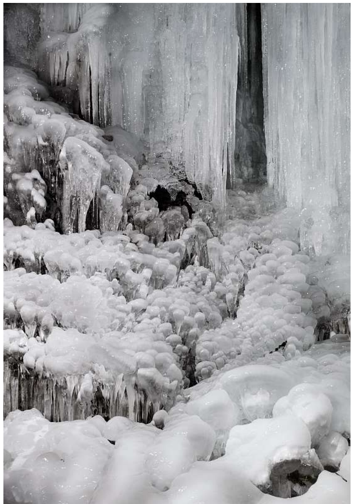
Die Vertikale, das Element des Ueli Steck. | Straight up: Ueli Steck's direction.